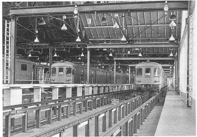
Bild 2. Neue Unterhaltsstände im bestehenden Depot F in Zürich

fallenden Reparaturen des Kurativ-Unterhalts S1 (technische Schäden und Störungen) und S2 (betriebliche Schäden infolge Zusammenstößen, Entgleisungen, Vandalenschäden usw).