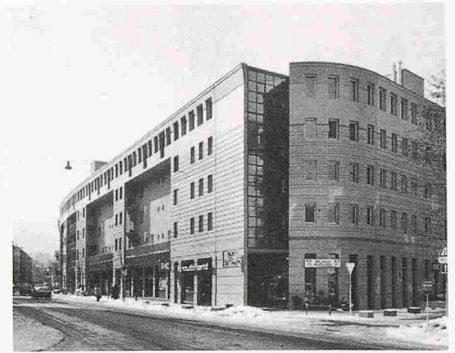
Wohnüberbauung Manessehof, Zürich, 1977–1984. Ueli Marbach und Arthur Rüegg, Zürich

Es blieb einem Tessiner Kollegen vorbehalten, einen Führer durch die Architektur der deutschen Schweiz herauszugeben. Dass daraus gleich auch noch etwas vom Besten geworden ist, was überhaupt in dieser recht armselig beackerten Sparte zu finden ist, nehme ich mit Befriedigung vorweg. Die Erleichterung ist doch sehr beträchtlich, wenn