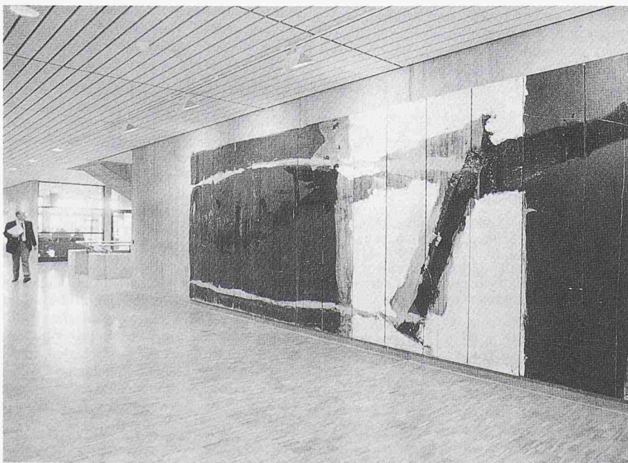
Kunst im Berufsbildungszentrum Grenchen, Erdgeschoss: Daniel Gemperle, Malerei auf Schalungstafeln, 2,50 x 7,00 m