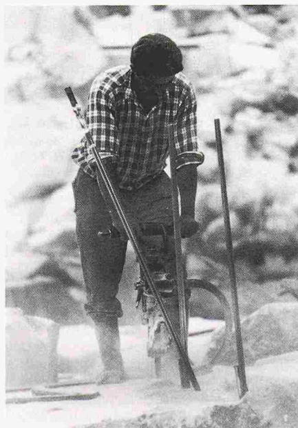
Ist sein Arbeitsplatz in Gefahr?

Ein weiterer Rückgang des Bauvolumens über das laufende Jahr hinaus ist ungeachtet anderslautender optimistischer Prognosen vorprogrammiert. Es bleibt zu hoffen, dass durch eine raschmögliche Verbesserung der gegenwärtig für das Bauklima negativ wirkenden Rahmenbedingungen verhindert werden kann, dass die eingetretene Abkühlung der Baukonjunktur in einen Einbruch ausartet.