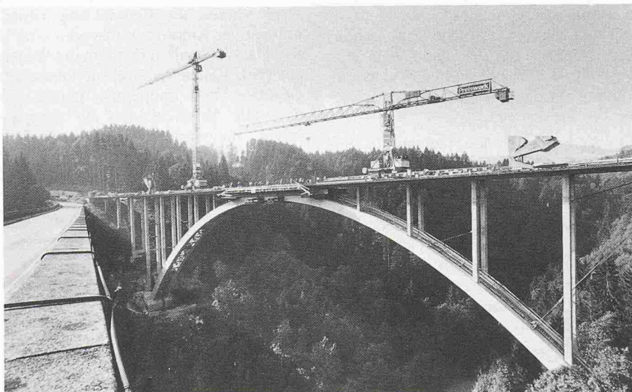
Die neue Hundwilertobelbrücke

Die neue Brücke ersetzt die aus den Jahren 1923/25 stammende sanierungsbedürftige Eisenbetonkonstruktion, welche trotz ihrer anerkannten bauhistorischen Bedeutung abgebrochen wird.