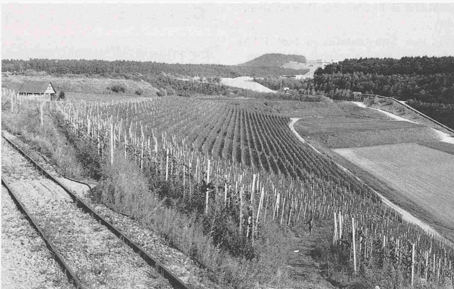
Beispiel für die mögliche Rekultivierung einer stillgelegten Kiesgrube: Auf dem Gelände des Kieswerks Hüntwangen ZH entstanden ein Weinberg und Ackerland