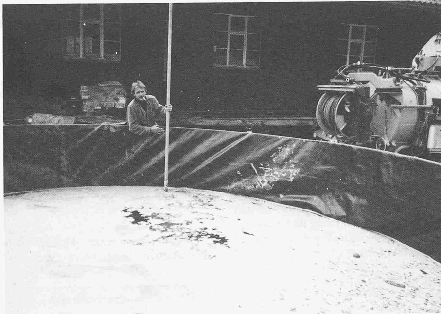
Bild 3. Mobiler Schnellmontage-Behälter im Katastrophen-Einsatz, Inhalt 45 000 Liter (Rückhaltung von durch Farben und Lösungsmittel kontaminiertem Überschwemmungsgut)

System um hand- oder automatisch betätigte Absperrvorrichtungen handelt.