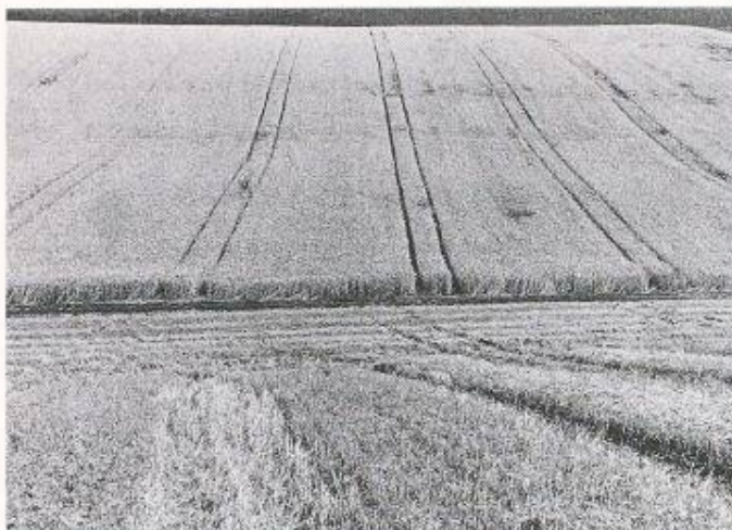
Bild 3. Durch die intensive landwirtschaftliche Produktion werden nicht bloss die anderen Bodenfunktionen verdrängt, sondern auch die Gewässer und die Luft belastet. Die agrarpolitischen Massnahmen sind so umzugestaltet, dass die Landwirte wiederum auch ökologische Leistungen erfüllen, dafür aber auch abgegolten werden