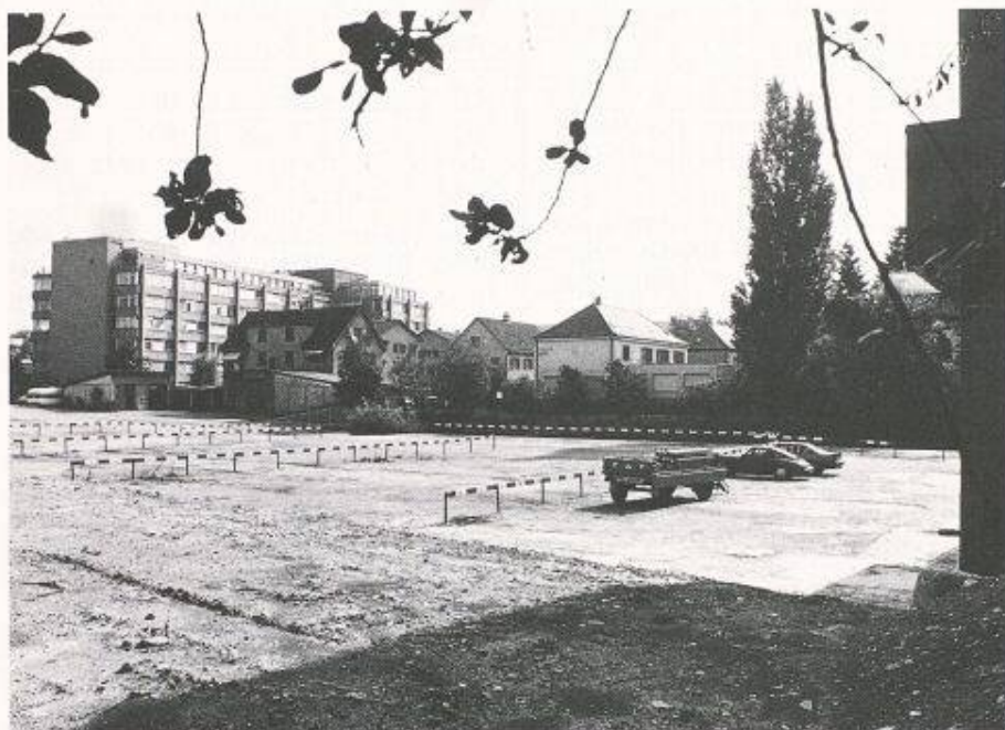
Bild 1. In den bestehenden Gebäuden und den weitgehend überbauten Gebieten werden viele Flächen schlecht genutzt. Diese Reserven würden genügen, um die absehbaren Bedürfnisse für umbaute Räume bis zum Jahre 2010 zu befriedigen, ohne dass weiteres Kulturland beansprucht werden müsste

reits genügen, um den geschätzten Bedarf von 300 000 bis 500 000 zusätzlichen Wohnungen bis zum Jahre 2010 zu decken. Auf Bahnarealen, in Einfamilienhausquartieren, aber auch in Mehrfamilienhausquartieren bestehen zudem erhebliche Verdichtungsmöglichkeiten (je nach Situation 15 bis 50% zusätzliche Bruttogeschossfläche), ohne dass dadurch die Wohnqualität gefährdet würde.