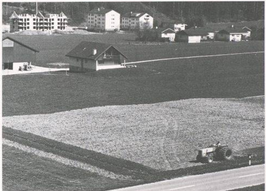
Bild 2. Überbauung und intensive landwirtschaftliche Nutzung beanspruchen exklusiv die Böden im schweizerischen Mittelland. Anzustreben ist aber eine multifunktionale Nutzung des Bodens, welche die ökologischen Funktionen wie Regelung der natürlichen Kreisläufe, Erhaltung von Flora und Fauna, Erholung der Menschen, miteinschliesst

Die Forschung über das Bodenleben und die Möglichkeit, seine Vielfalt und seinen Zustand als Indikator für die Bodenfruchtbarkeit zu nutzen, stehen erst am Anfang. Immerhin sind aufgrund der bisherigen Untersuchungen die folgenden Schlüsse zulässig: