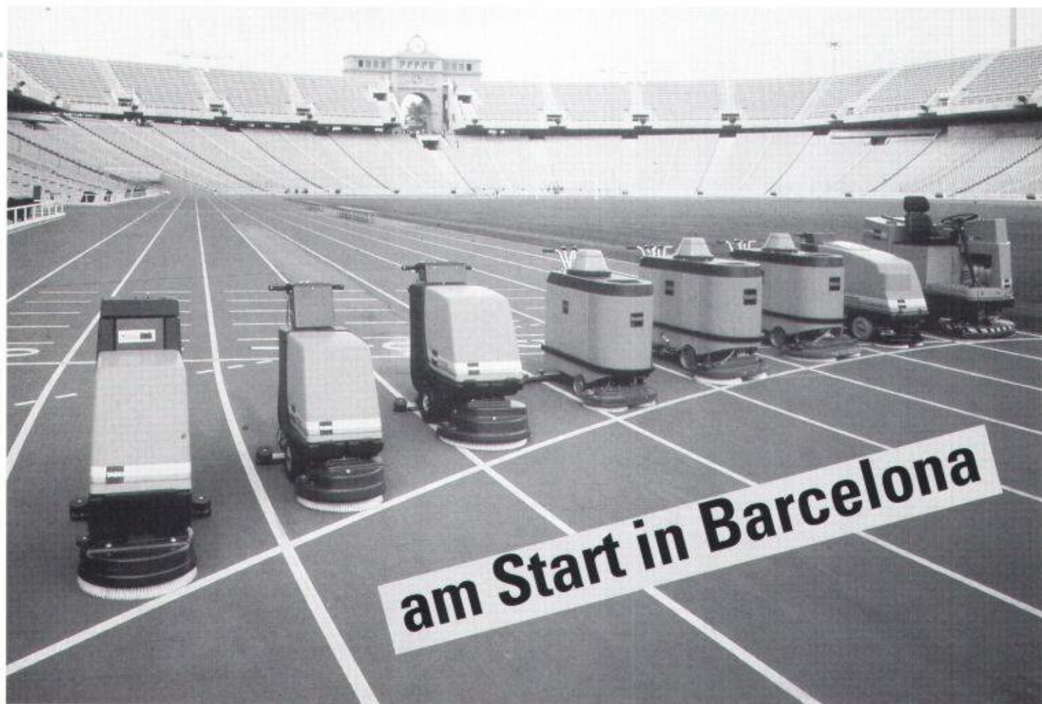
Die Sporthalle Sant-Jordi und das Olympia-Stadion werden mit TASKI Material gereinigt.

Wenn die besten Sportler der Welt in Barcelona um Olympisches Gold kämpfen, geht auch TASKI an den Start. Mit einer erstklassigen Putzstaffel sorgt der Marktleader im Olympia-Stadion und in der Sant-Jordi-Sporthalle für saubere Spiele. Angeführt wird die TASKI Olympia-Delegation vom combimat 4000 (Bild) mit seinem rekordverdächtigen Putzleistungs-