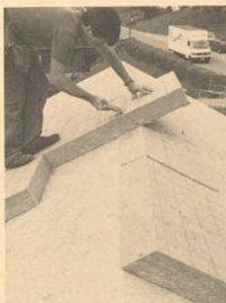
Bild 1. Verlegung Sarnaroc Nova, Bearbeitung am First

und Schallschutzanforderungen bestehen und ein Warmdach auf Holzkonstruktion vorgesehen ist, stellt die Sarnaroc Nova-Platte eine interessante Alternative dar. Die verdichtete obere Zone der Platte mit einem Raumgewicht von zirka 150 kg/m 3 erlaubt eine gute Verschweissung der Sarnafil Unterdachbahn