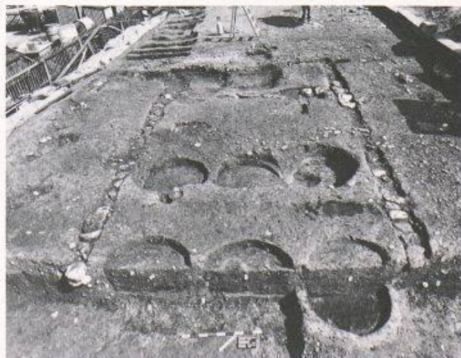
Ausgrabungen an der Römerstrasse in Oberwinterthur brachten Fundamente eines römischen Werkstattgebäudes mit den Vertiefungen von sechs eingegrabenen Fässern zutage