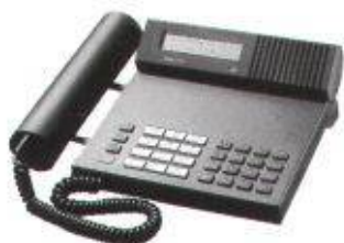
Das formschöne Brigitt 100 mit Lautsprecher, Display und Message-Anzeige für wirtschaftlichen Telefonkomfort.

Für Unternehmer, die mit Teamwork gross werden. Ascoline.