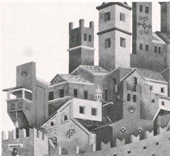
Bild 6: Fresko von Giotto (Titelbild zu Italo Calvino: Die unsichtbaren Städte )

Gegenwart, werden die Situationen der einzelnen Zeitabschnitte verdeutlicht. Im Mittelpunkt steht dabei der Konflikt zwischen dem selbständig denkenden und handelnden Einzelgänger und der politisch opportunistischen Mehrheit.