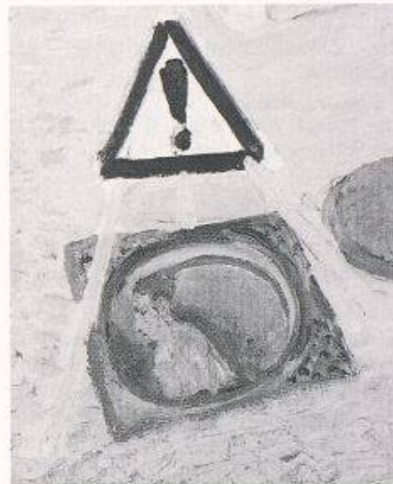
Bild 8: Bild von Varlin (Titelbild zu Hugo Loetscher: Abwässer - Ein Gutachten )

«Er liebte es, im Lichte von Tischlampe und Globus über Landkarten zu sitzen und mit dem Zeigefinger neue Routen abzufahren. Hatte er sich in einer Hochebene verirrt, brauchte er bloss den Blick zu heben, um in die Wirklichkeit zurückzufinden. (...) Seine Trauer bewältigte er in den eigenen vier Wänden, über Landkarten sitzend, da ihn die Be-