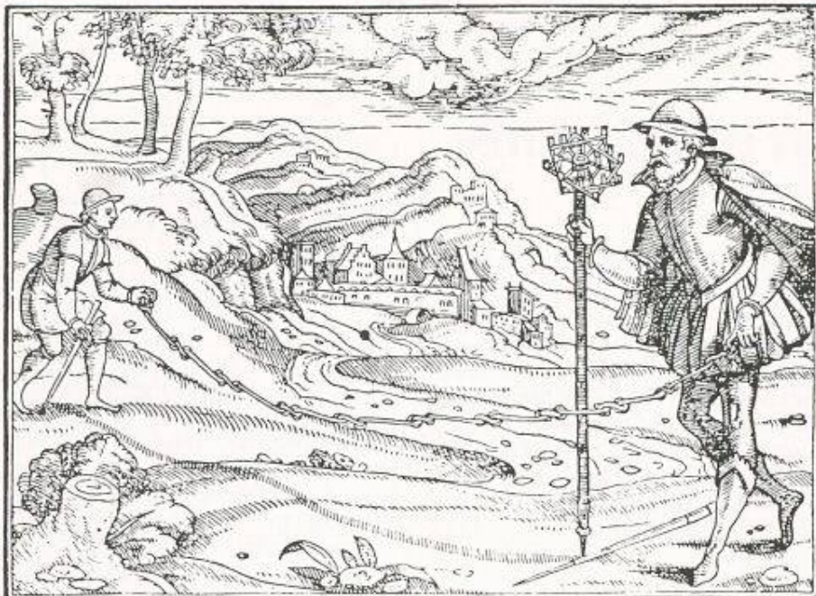
Bild 1: Landmesser mit Kreuzvisier und Messkette (In: C. Stephan, J. Liebhalt: «Von dem Feldbau», 1579)

Die folgenden Zitate mögen dazu einen kleinen Einblick geben: