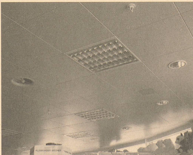
Einsatz der Klemmsystem-Metaldecke «Q-Clip» beim Warenhaus ABM, Olten

Oft ist es jedoch nicht notwendig, die ganze Deckenfläche klemm- oder klappbar auszuführen. Speziell bei grossflächigen Decken