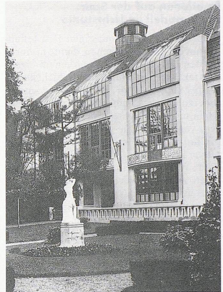
Die Grossherzogliche Kunstschule in Weimar, 1904, das spätere Bauhaus

Van de Veldes Weg führte keineswegs in gerader Linie zur Architektur. 1863 in Antwerpen geboren, waren seine Zeitgenossen etwa Muthesius , Horta , Guimard , Olbrich , Mackintosh , Behrens – mit etwas Abstand Poelzig , Riemerschmid , Hoffmann und Wright . Als Maler in Antwerpen, Paris und Brüssel