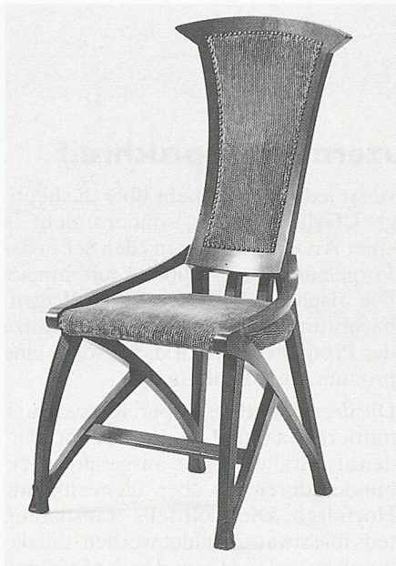
Stuhl, Nussbaum mit geripptem Cordbezug, 1898

Henry van de Velde ist weder mit den vertrauten Massstäben zu messen noch auf einfache Weise in eine der gängigen Kategorien der Kunst- und Architekt-