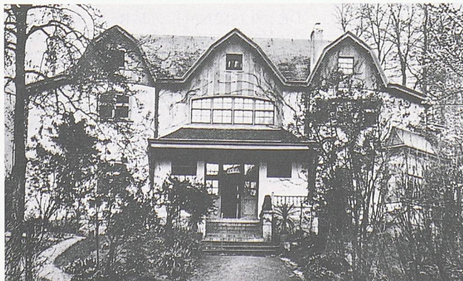
Haus Blomenswerf, Uccle, 1895

Zwei Namen waren für die Entwicklung van de Veldes von wesentlicher Bedeu-