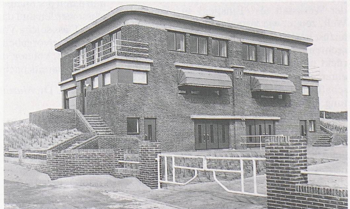
Haus Colmann & Saverijs, Knokke, 1931