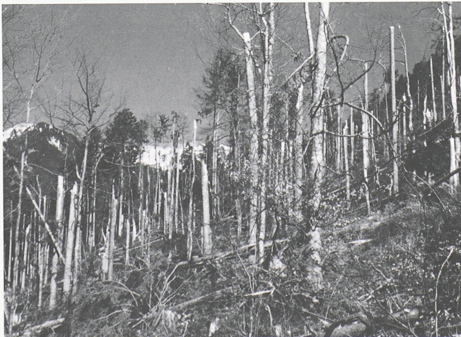
Der berühmte Sturm «Vivian» hinterliess 1990 in vielen Alpen- und Voralpengebieten stark geschädigte Wälder, was die Ausbreitung des Borkenkäfers begünstigte

Seit dem Jahrhundertsturm «Vivian» vom Februar 1990 haben sich die Borkenkäfer in den Schadengebieten deutlich vermehrt. Vor allem in den stark betroffenen Regionen der Alpen und Voralpen konnte in den letzten zwei Jahren ein kontinuierlicher Anstieg des Käferbefalls beobachtet werden (F. Meier et al., 1992). Hauptbeteiligter an der Massenvermehrung ist eindeutig der Buchdrucker ( Ips typographus ). Zwischen dem Ausmass der Sturmschäden und der Menge der durch den Buchdrucker befallenen Fichten besteht ein enger Zusammenhang. In der Schweiz muss für 1992 mit Zwangsnutzungen von rund 500 000 m 3 Käferholz gerechnet werden, was rund 20% einer jährlichen Nadelholz-Nutzung entspricht, soviel wie noch nie in diesem Jahrhundert.