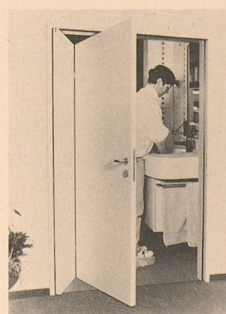
Platzsparende, patentierte Falttüre von Geilinger, Elgg