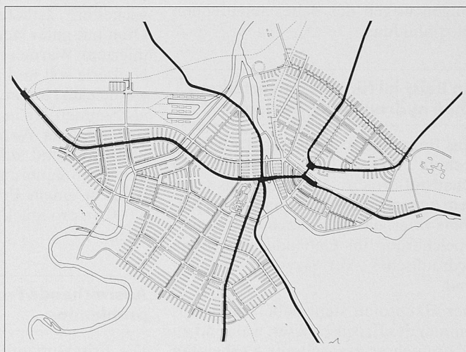
Plan Directeur der Stadt Genf, 1935