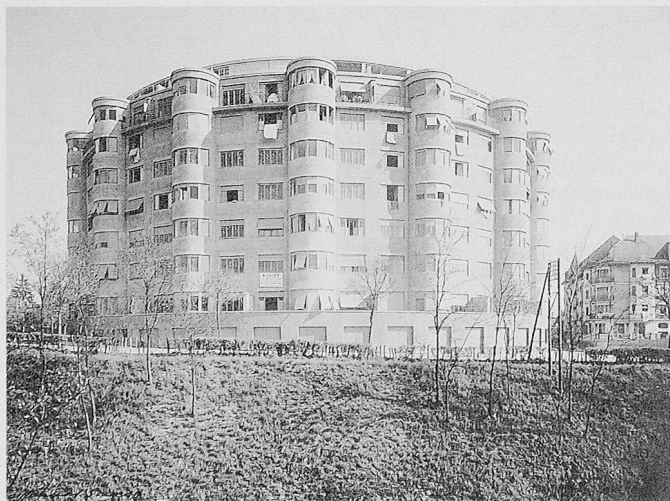
Maison Ronde, Strassenseite, 1931