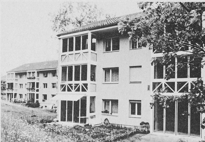
Vor allem bei Sanierungen und Umbauten ist die nachträgliche Verglasung von Balkonen eine sinnvolle und beliebte Massnahme

Die neugewonnene Pufferzone ist mehrfach energiewirksam: Wärmeeinfall durch die Sonneneinstrahlung, Verringerung der Wärmeverluste und Klimaausgleich bei den angrenzenden Wohnräumen. Die Höhe des Material- und Kostenaufwandes und der tatsächliche Energiege-