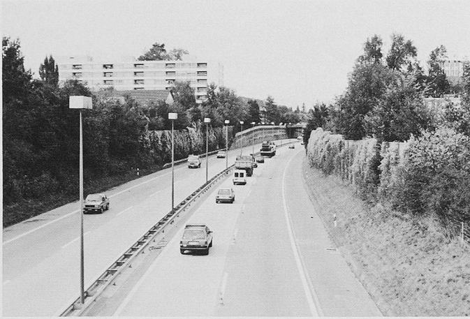
Bild 1. Die Autobahnstrecke vor dem baulichen Eingriff. Wohnblock nach Eröffnung erstellt