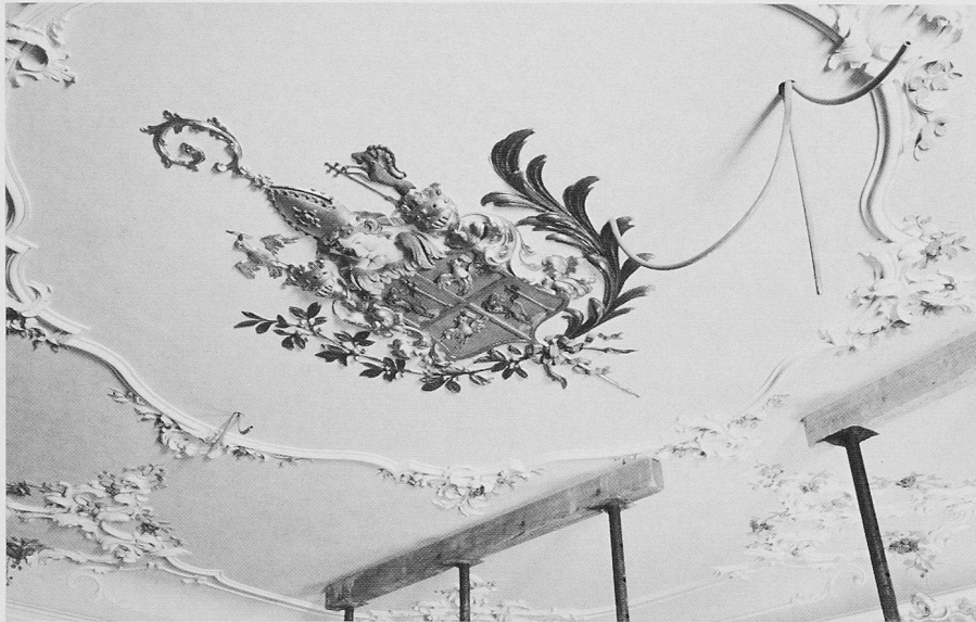
Bild 3. Hotel Hof, Bad Ragaz. Stukkaturdecke

die die Lebensdauer einer Decke und insbesondere der mitverwendeten alten Balken und Schrägböden begrenzen würden. Sieht man von der durch den Aufbeton in der Regel resultierenden höheren Deckenlast ab, ergibt sich durch die Verbundbauweise keine Veränderung des Tragsystems, da die Decke nach wie vor auf den Balkenköpfen oder auf gleitenden Lagern ruht, sodass die Gesamtkonstruktion ihre Beweglichkeit behält. Eine Wiederherstellung des ursprünglichen Zustandes ist bei Verbund-Betonkonstruktion mit ähnlichem Aufwand möglich, wie etwa bei Deckenverstärkungen durch seitliches Laschen mit Holzbohlen oder Stahlträgern, wobei diese Konstruktionsweise gerade bei eingeschobenen Schrägböden kaum effizient anwendbar ist.