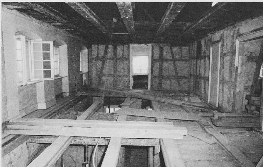
Bild 1. Gasthof Löwen, Vaduz. Obergeschoss während der Bauphase

Zeitgemässe Nutzungen stellen jedoch an ein Gebäude entsprechende Anforderungen hinsichtlich Tragfähigkeit, Brand-, Schall- und Wärmeschutz sowie der Hygiene. Dies macht die Anwendung neuer Technologien erforderlich, die zum Zeitpunkt der Entstehung des betreffenden Gebäudes noch nicht bekannt waren (Bild 2). Eine Forderung, die von Denkmalpflegern und Archäologen verschiedentlich in Zweifel gezogen wird. Teilweise schwingt dabei eine naive Romantik nach System Hundertwasser mit, «die auf die Wiederherstellung längst verlorener Lebens- und Bauweisen hofft» [7]. Dem Denkmalschutzgesetz kommt jedoch im Vergleich zu all den anderen Gesetzen keine Vorrangstellung zu. «Soll an einem Baudenkmal eine Veränderung vorgenommen werden, so geht der Denkmalschutz nicht eo ipso den anderen Gesichtspunkten vor, wie z.B. der Verkehrsplanung, wirtschaftlichen Erwägungen des Eigentümers, Fragen der Feuersicherheit usw. Der Gedanke des