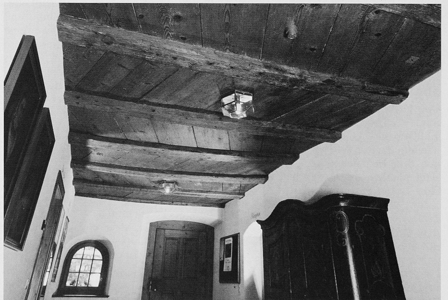
Bild 6. Gasthof Löwen. HBV-verstärkte Balkendecke mit Schrägböden aus dem 17. Jahrhundert