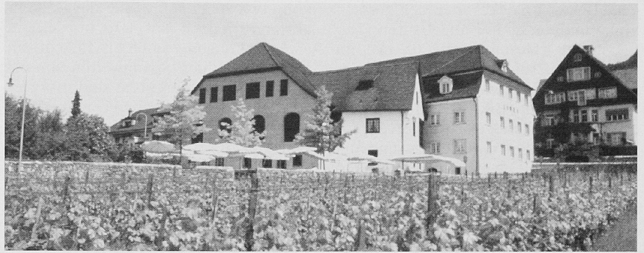
Bild 4. Gasthof Löwen, Vaduz. Ansicht von Südwest

Über dem Nordteil des Erdgeschosses, dem Eingangsflur und der heutigen Bar (ca. 76 m 2 ) wurden die Balkendecken mit eingeschobenen Schrägböden im Holz-Beton-Verbundsystem verstärkt (Bild 6). Die vorhandenen Balken stammen von Fichten, die im Herbst/Winter 1665/66 gefällt wurden. Die Balken weisen im Durchschnitt einen quadratischen Querschnitt von 20 cm sowie einen durchschnittlichen Abstand von ca. 85 cm auf; die freie Spannweite beträgt ca. 4.30 m. Ein besonderes Anliegen war es hier, die freigelegten Schrägbodenbretter sichtbar behalten zu können.