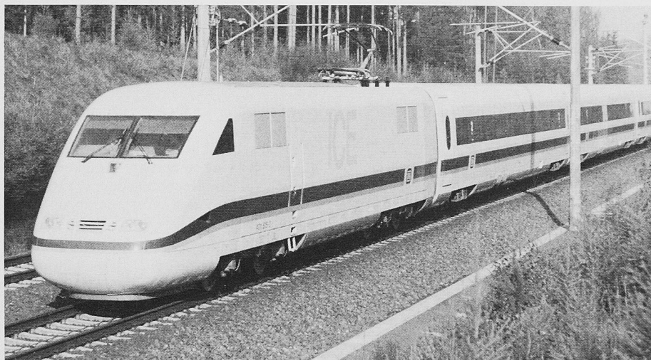
Der ICE der Deutschen Bahn hat erfolgreiche 1000 Tage Einsatz hinter sich

München und Berlin-München) dieser 1. Ausbaustufe.