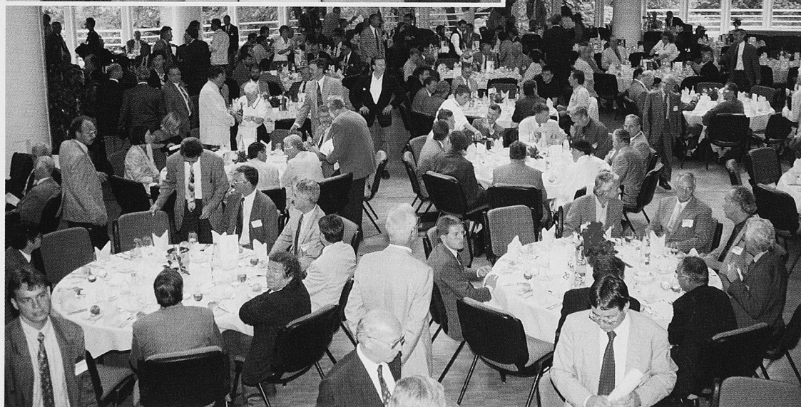
«Kunstpause» zwischen der eindrucksvollen Eröffnungsfeier und den breitgefächerten Veranstaltungen der insgesamt acht Fachgruppen (◀)