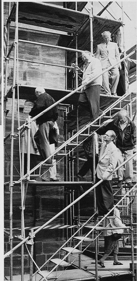
Trepp auf, Trepp ab und quer über die Grenzen an den Exkursionen am Regio-Tag (▶)