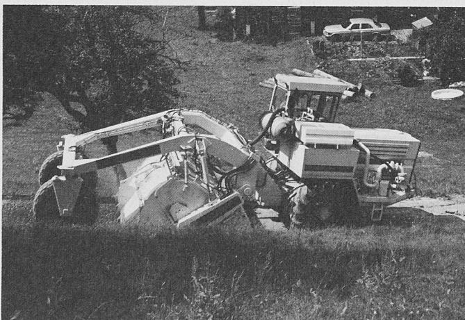
Raco 250: Fräsen des Koffers und evtl. anstehendes Material mit Belag, total 42cm stark, sowie Dosieren von C444 und Mischen in einem Arbeitsgang

Die Firma Hamm hat den bewährten Raco-250-Bodenstabilisierer weiterentwickelt und mit neuen Rotoren ausgerüstet.