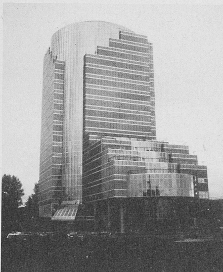
HIT-Verglasung beim Gateway Station Tower, Vancouver

Innotherm AG 8274 Tägerwilten Tel. 072/69 28 82