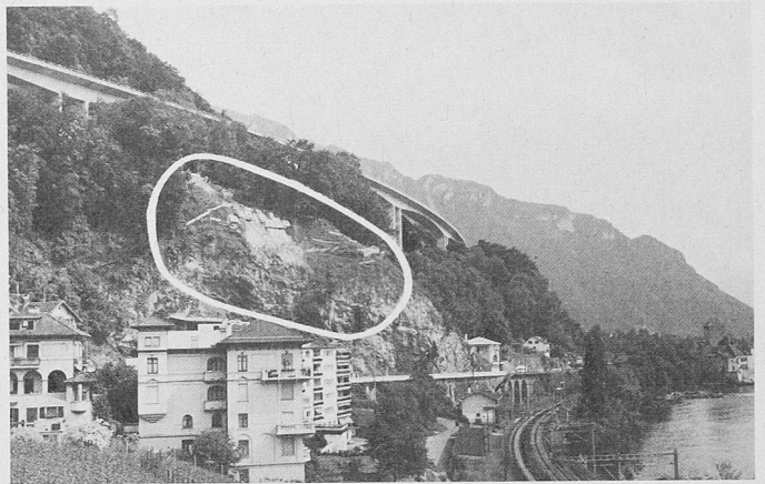
Kurz vor Pfingsten hat sich beim Schloss Chillon ein ca. 100 Kubikmeter grosses Teil des Hanges über dem Felsen gelöst. Das weisse Oval zeigt das mit dem Leica-System APSWin überwachte Gebiet.