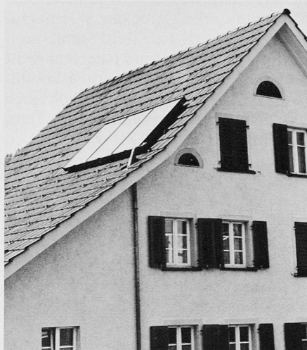
Bild 1. Der 5 m 2 grosse Kollektor mit der noch etwas unschönen Verbindung zum Regenfallrohr, in dem Vor- und Rücklauf liegen

Der aktive Teil des Kollektors, der Absorber, misst 4,5 m 2 . Ohne Verglasung wiegt die Aluminiumkonstruktion 48 kg – für zwei Monteure noch tragbar. Am Kollektor ist nur eine gemeinsame Öffnung für Vor- und Rücklauf des Solarkreislaufes eingelassen. Die schlanke Konstruktionweise ist auch am Kupfereinsatz erkennbar: Solkit beinhaltet 2,2 kg Kupfer pro m 2 Absorberfläche; andere Absorber bringen das doppelte oder dreifache auf die Waage. Interessant sind die Kupfergewichte vor allem im Hinblick auf allfällige Ökobilanzen und Nettenergieanalysen von derartigen Energiesystemen.