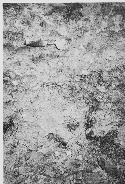
Bild 2. Kontaminierter Boden. Farbveränderungen im Bodenprofil als Folge der Infiltration von Öl und der mikrobiellen Abbauprozesse. Farbbereiche: braun, originale Bodenfarbe (oxidiert), grünlich grau: reduzierte Bodenfarbe, schwarz: Ölresten.)

wenn wichtige diagnostische Bodenmerkmale nicht in die Profilbeschreibungen eingehen. Sie bringen sich so um entscheidende Interpretationshilfen, etwa wenn es um die Frage geht, ob in einem Profil der ursprüngliche Bodenzustand durch Perkolationsprozesse verändert ist (Bild 2). Dem Auftraggeber entstehen in der Folge Mehrkosten, weil beispielsweise statt gezielter Probenahmen Rasterbeprobungen ausgeführt werden, deren Aussagekraft in den meisten Fällen aus geostatistischen Gründen sehr bescheiden ist.