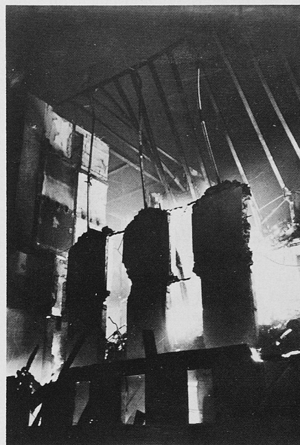
Bei rund 20 000 Brandfällen entstehen jährlich Sachschäden von rund 600 Millionen Franken

Die Brandschutzrichtlinien regeln den Stand der Technik. Sie müssen in kürzeren Zeitabständen den neuen Erkenntnissen der Forschung sowie neuen europäischen Normen angepasst wer-