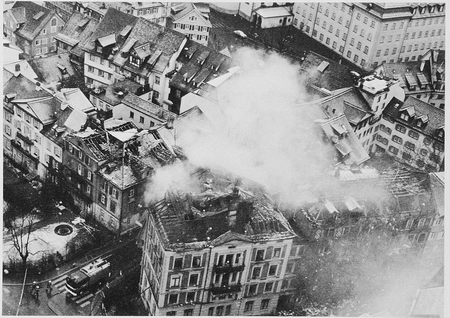
Bei diesem Brand in der Altstadt von St. Gallen verloren am 14. März 1992 vier Menschen das Leben. Der Feuerwehreinsatz wurde durch heftige Sturmwinde erschwert

Heute darf festgestellt werden, dass alle Kantone die Bereitschaft zeigen, die neuen Empfehlungen der VKF bis 1995 ins kantonale Recht zu übernehmen. Ab 1. Januar 1994 haben die Brandschutzvorschriften der VKF in folgenden Kantonen Gültigkeit: AR, BL, GL, GR, JU, SG, SH, VS und ZH. Der derzeitige Stand der Inkraftsetzung ist aus Tabelle 1 ersichtlich.