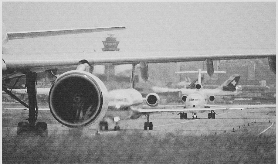
Bild 3. Stau im Luftverkehr

Bekannt Vorschläge im direkten Verkehrsbereich sind: bessere Koordination der Lichtsignalanlagen, Reduktion der Parkplätze für Pendler, Förderung des öffentlichen Verkehrs sowie Ver-