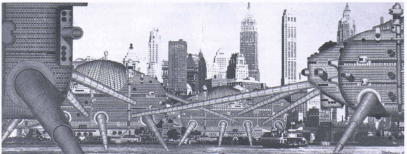
Walking City, Ron Herron, 1964