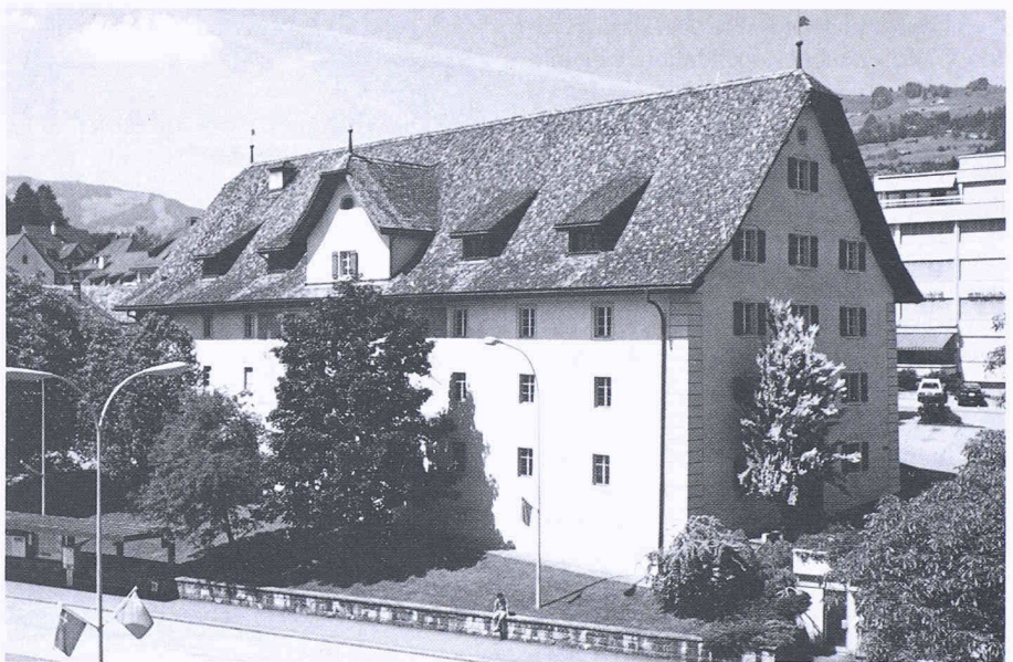
Im 1714 als Kornspeicher geplanten und zuletzt als Zeughaus genutzten Gebäude wird in Schwyz die Ausstellung «Forum der Schweizer Geschichte» präsentiert

Verantwortlich für Umbau und Renovation des Gebäudes zeichnet die Arge der Architekten H. Steiner, A. Scheitlin, M. Syfrig . Dabei war der Grundsatz des modernen Denkmalschutzes, Altes bewahren und