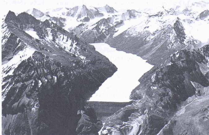
Die Staumauer der Grande Dixence im Kanton Wallis, erlaubt 400 Mio. m 3 Wasser zu speichern

(BKW) Die Bernischen Kraftwerke AG und die Gemeinde Zweisimmen ziehen eine positive Bilanz aus den ersten Erfahrungen mit der elektronischen Lichtmen-genregulierung bei der öffentlichen Beleuchtung. In den drei Betriebsjahren wurden bei gleichbleibendem Komfort insgesamt rund 19 000 kWh weniger Strom auf-gewendet, was einer Einsparung von 20% entspricht. Im gesamten BKW-Versorgungsgebiet könnten bei konsequenter Anwendung dieser Technik 3 Mio. kWh ein-gespart werden.