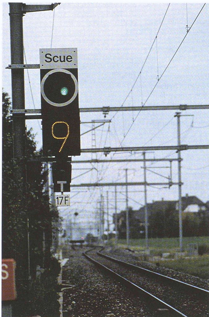
Die DfA verwaltet die Anlagen aller Fachdienste, gegliedert in Objektklassen (Fahrleitungsmasten, Brücken ...). Zu jedem Objekt der Objektklassen sind eine Reihe Daten und graphische Informationen verfügbar

des Ist-Zustandes kann mit der Hinterlegung von gescannten, bestehenden Plänen überbrückt werden.