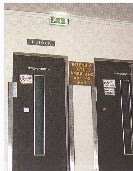
Kürzlich neu an der Decke eines Spitals montierte Fluchtwegzeichen, die zuerst vom Rauch verdeckt werden und zudem ausgerechnet über dem nicht zu benützenden Lift stehen

Damit seien die kritischen und pessimistischen, aber notwendigen Feststellun-