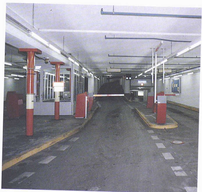
Einfahrt Parkhaus "Hohe Promenade", Zürich: an den Säulen links im Bild gelbe nachleuchtende Bänder mit Pfeilen zum Aus- gang

Bei den A-/C-Gefahren ist dem Umgang mit Chemikalien und radioaktiven Präparaten, deren Transport und Verschluss, dem Verhalten beim Unfall mit solchen Stoffen und der allenfalls notwendigen Dekontaminierung Beachtung zu