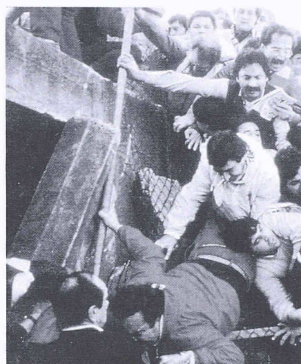
Flüchtende Masse im Heysel-Stadion

Die zweite Assoziation beim Stichwort «Sicherheit» führt zum Brandschutz. Zeitgemässe und heute selbstverständliche Brandschutzmassnahmen tragen entscheidend zur Risikominderung bei. Verhindern können aber auch sie schwere Unfälle und