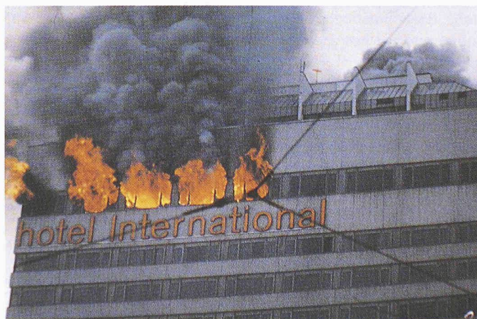
Brand Hotel International, Zürich

Die verschiedenen Riskmanagementprobleme und deren zufriedenstellende Lösung setzen ein gesamtheitliches Konzept voraus, das aufzeigt und beschliessen lässt, welcher der aktuellen Bedrohung flexibel anpassbarer Schutz angemessen ist. Die Umsetzung der Erkenntnisse erfolgt zweckmässigerweise auch in diesem Fall bereits in der Planungsphase, damit man nicht den oft begangenen und meist teuren Fehler nachahmt, umfassende Sicherheit erst kurz vor der Inbetriebnahme oder gar erst, wenn die Bedrohung eingetreten ist, einzubauen.