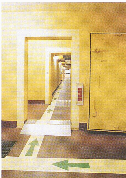
Fluchwegmarkierung und Äusgänge markiert mit nachleuchtender Farbe

gen abgeschlossen. Es ist sehr verdienstvoll, dass die SIA-Fachgruppe der Ingenieure der Industrie die Problematik erkannt und das Thema Risiko und Sicherheit zum Thema ihres diesjährigen Jubiläums-Weiterbildungskurses gemacht hat. Eine hinlänglich bekannte Schwierigkeit besteht allerdings in der gleichen Erscheinung wie bei Weiterbildungskursen für Autofahrer. In aller Regel werden solche von jenen besucht, die schon ein beachtliches fahrerisches Können und Erfahrung haben und gerade deshalb die Notwendigkeit einer Weiterbildung erkennen. Dies dürfte bei dieser Veranstaltung kaum anders sein. Es muss deshalb auch darum gehen, die hier gewonnenen Erkenntnisse nach aussen zu tragen und vor allem die Bauherren von der Notwendigkeit eines umfassenden Sicherheitskonzeptes in der Planungsphase zu überzeugen. Sie tragen letztlich einen erheblichen Teil der Verantwortung, nur spüren sie dies oft erst, wenn der Untersuchungsrichter nach Unterlassungen forscht.