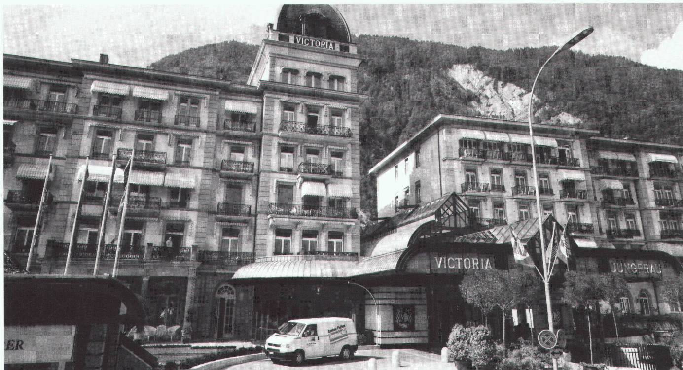
Architekt: Züblin Anlagen + Projekte AG, Zürich Bauausführung: Schaller Trockenbau AG, Belp

Hervorragender Schallschutz und eine beeindruckende Optik waren die Ansprüche der Architekten des Interlaken Hotels, realisiert wurden sie mit FERMACELL. Das geringe Gewicht und die universelle Einsetzbarkeit machen FERMACELL zum rationellen Werkstoff in allen Bereichen der Renovierung und Sanierung: FERMACELL ist Bau-, Feuchtraum- und Feuerschutz-Platte zugleich. Ideal für Decke, Wand und Boden: Estrich-Systeme, Trennwände und Decken mit geprüften Konstruktionen für verschiedenste Anforderungen.