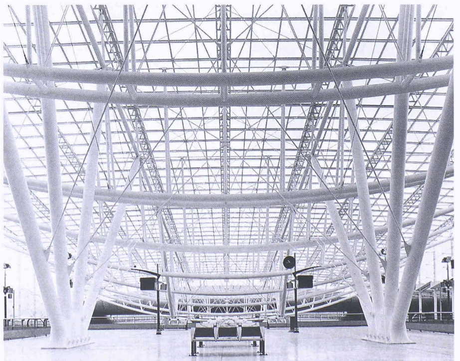
Bild 3. Riesige, aufgefächerte Stahlpylonen tragen die Elemente der Überdachungskonstruktion, die im oberirdischen Teil schräg ansteigt

Das Konstruktionsprinzip ist einfach, die Ausgestaltung äusserst raffiniert und komplex, vor allem in den beiden oberirdisch ansteigenden Gebäudeteilen rechts