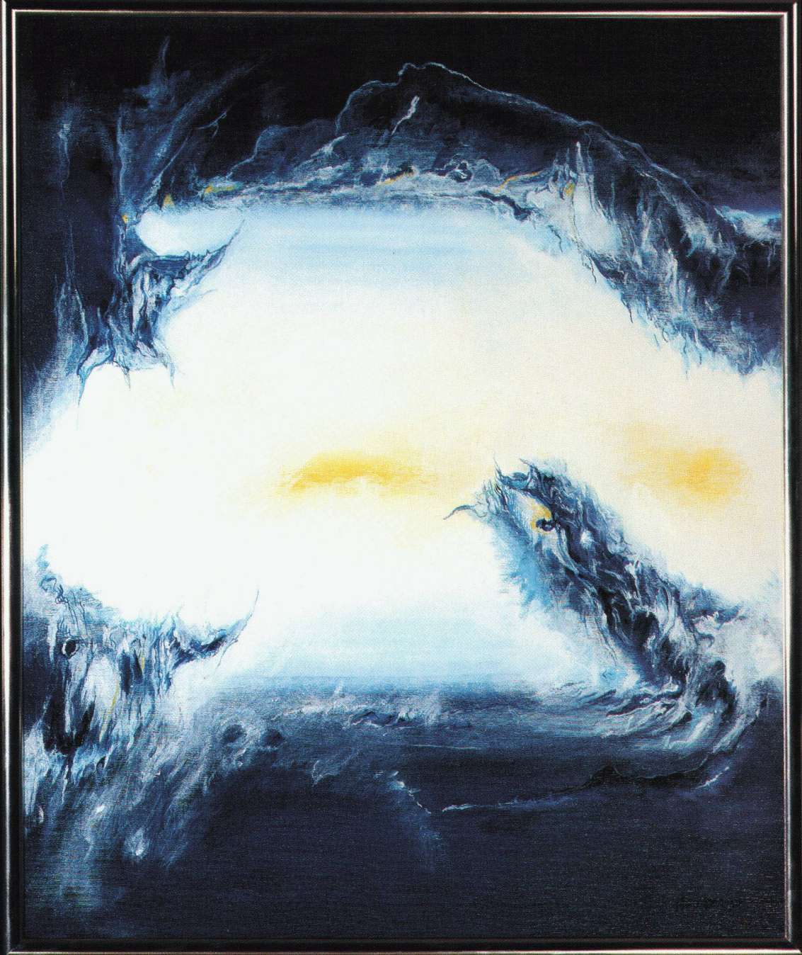
H.P. Werder «Dynamischer Zug», Oel auf Leinwand

schiedelkamin® schiedelkamin® schiedelkamin® schiedelkamin®