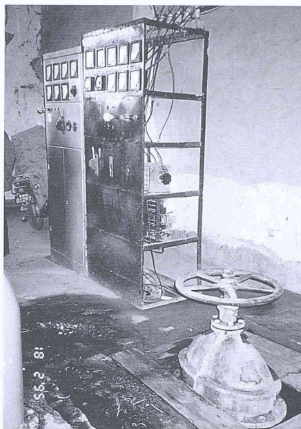
Kraftwerk Ca Ba La: Schaltschrank

Schliesslich wurden sechs Anlagen für eine in Frage kommende Rehabilitation ausgeschieden. Die Wiederinstandsetzungsarbeiten sollen noch im laufenden Jahr in Angriff genommen werden, so dass die betroffenen Dorfgemeinschaften schon bald wieder über elektrischen Strom verfügen können.