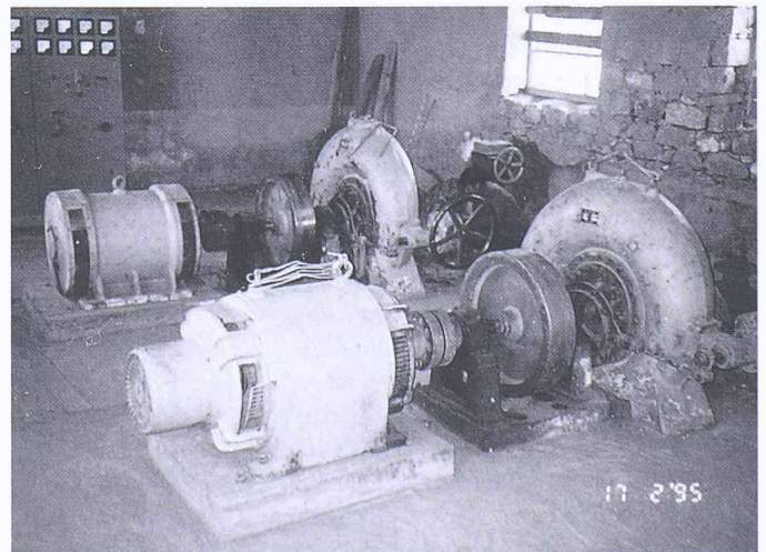
Kraftwerk Dön da: Zentrale (links), Turbogruppen (rechts)