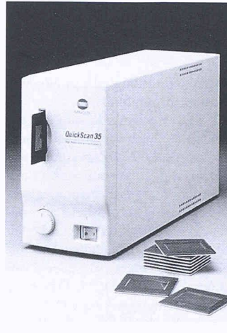
Filmscanner Quick-Scan 35

Auf dem Orbit-Stand der A. Messerli AG hat nun auch das Schweizerische Fachpublikum Gelegenheit, sich mit dem schnellen 35-mm-Filmscanner vertraut zu machen. Die Anbindung des Quick Scan, womit hochauflösende Digitalreproduktionen von 35-mm-Dias per Adobe Photoshop Plug-in-Software von einem Macintosh-Rechner (später auch WinPC) importiert werden können, erfolgt über eine SCSI-2-Schnittstelle. Auf diesem Wege lässt sich Bildmaterial problemlos archivieren, nachbearbeiten und über Ausgabegeräte wie den Minolta CF 80 oder sonstige Farbdrucker wieder ausgeben. Der digitale