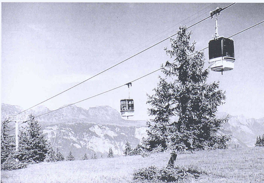
Bild 1. Kabinenbahn Tannenheim-Prodalp im Moorperimeter