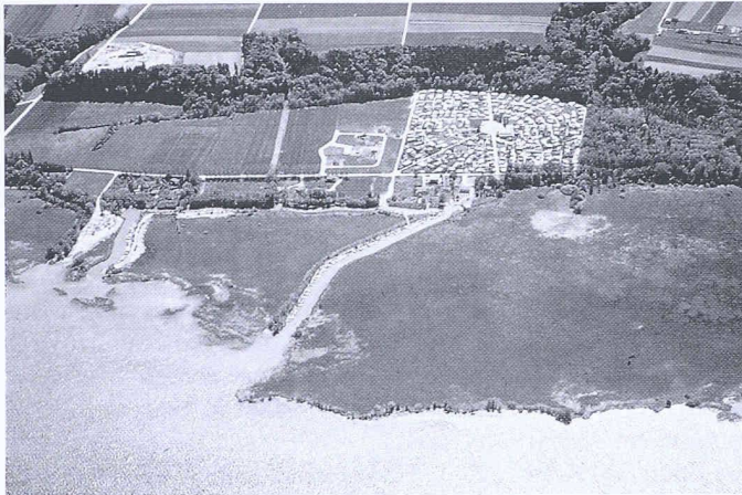
Bild 3. Hafenanlage in Gletterens