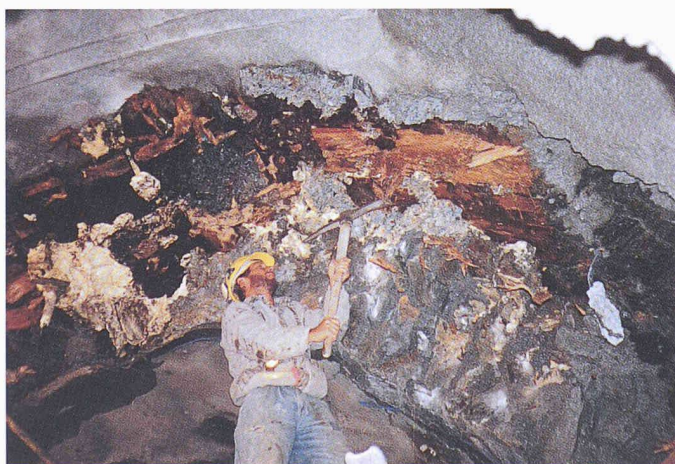
Bild 2. Altes und neues Tunnelgewölbe im Rufenen-Tunnel: Gut sichtbar sind die Hinterfüllungen