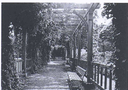
Gartenromantik in der Neumünsteranlage von 1916 in Zürich Riesbach

In einer wiegenden Hängematte unter hohen Bäumen – die allererste, starke und datierbare Erinnerung einer Zweijährigen, bei einem Verwandtenbesuch in Schweden. Wohl die meisten von uns tragen irgendwelche «Gartenbilder» tief in sich, Momentaufnahmen von Stimmungen, Düften, Farbklingen, Geräuschen, vielleicht von Harmonie und Glücksgefühl. Das können Gärten uns schenken!