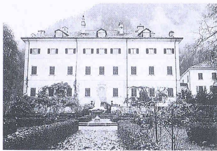
Mit einem Beitrag aus dem Talererlös 1995 soll der Garten des Palazzo Salis in Bondo/Bergell saniert werden