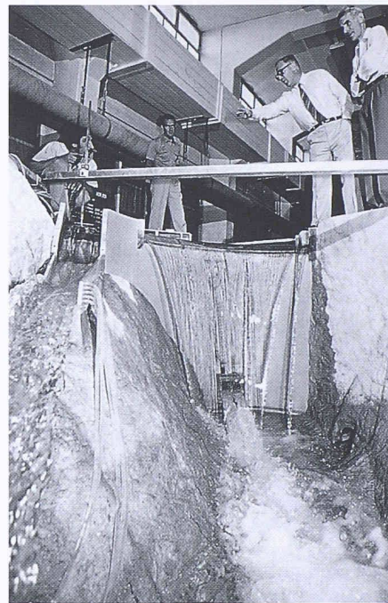
Modellversuche in den Versuchshallen der VAW an der ETH Zürich mit nachfolgenden Berechnungen sind die Voraussetzung für sichere Konstruktionen in der Praxis

Nun können solche Wassermengen mit dieser Geschwindigkeit am Fusse einer Talsperre nicht einfach frei in das darunterliegende Bachbett entlassen werden, sondern müssen erst von einer Schussrinne oder einem Ableitungsstollen aufgenommen werden. Je schneller und in je grösseren Mengen Wasser fliesst, desto mehr neigt es dazu, Luft aus der Umgebung aufzunehmen und desto turbulenter sind die Strömungen, die dabei entstehen. Diese durch Unterdruck verursachten Turbulenzen schränken nicht nur die Kapazität von Durchlässen und Schussrinnen ein, sondern können auch zu Resonanzen und damit zerstörerischen Vibrationen führen. Schwingungen treten im übrigen häufig auch an unter- oder überströmten Schützen von Wehren bei Flusskraftwerken auf.