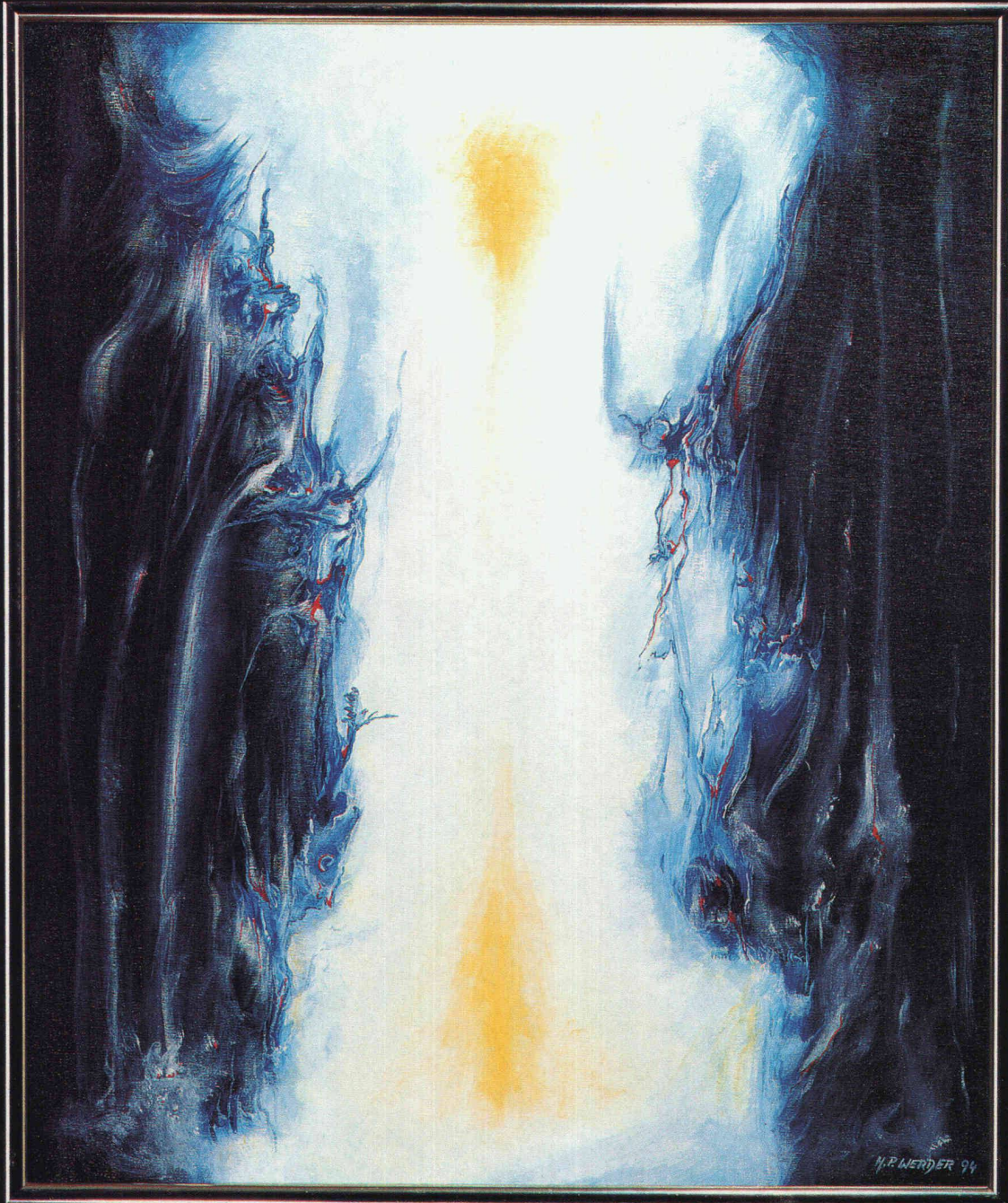
H.P. Werder «Durchbruch», Oel auf Leinwand

schiedelkamin schiedelkamin schiedelkamin schiedelkamin®