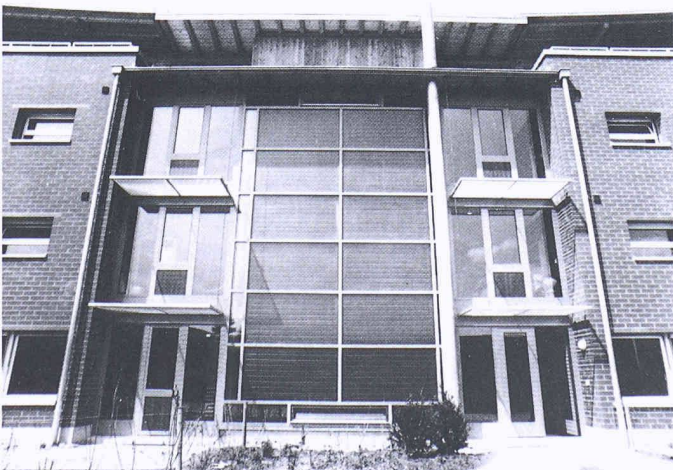
Solarpreis 1994. Mehrfamilienhaus in Murten; Architektin: Ursula Willen-egger-Röthenmund