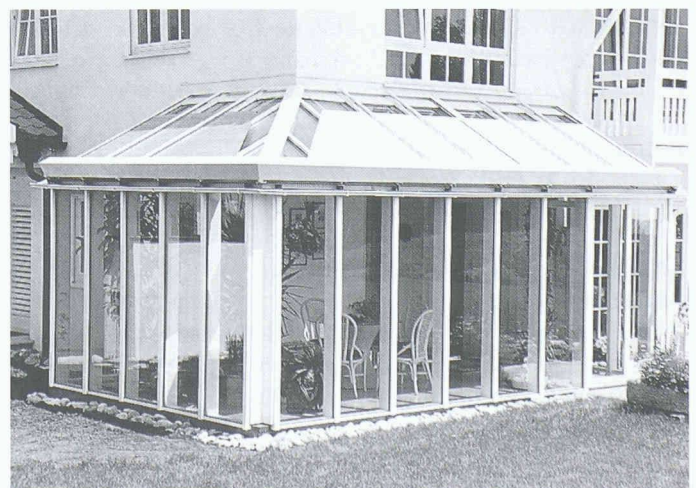
High-Tech-Rolläden für jede Schräglage

Brunner AG 4203 Grellingen Tel. 061/741 20 46