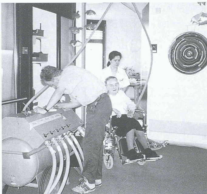
Die Rohrsanierung im Pflegeheim störte kaum den normalen Betrieb