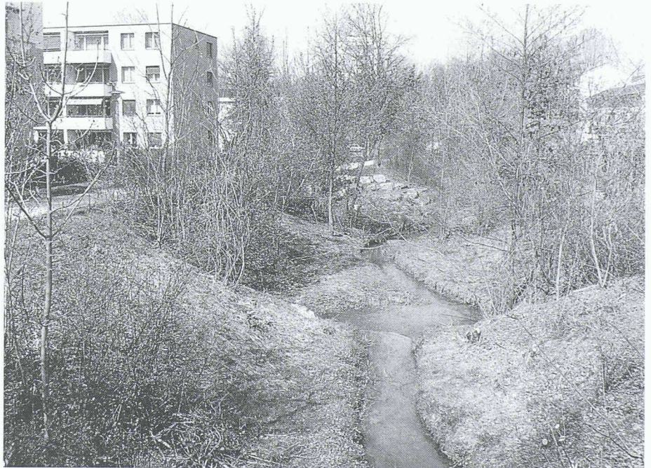
Ein grosses Anliegen des Wettbewerbs zum Europäischen Naturschutzjahr betraf die Sensibilisierung der Bevölkerung für ihren Lebensraum. Im Themenbereich «Wasserbau» galt die Hauptbestrebung dem Wiedersichtbarmachen von Wasserläufen in Siedlungen und Landschaft