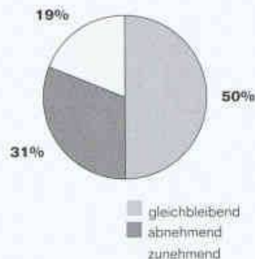
↑ Auftragsbestände per 31.3.96

Die selektionierende Funktion der Tiefpreispolitik hat zur Folge, dass bei Ausschreibungen kompetente und qualitätsbewusste Planer nicht mehr ins Marktgeschehen eingreifen können, weil die von