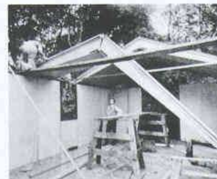
5 Fertighäuser mit Faltdach in Sperrholz um 1942. Diese Fertighäuser standen bei der U.S. Army im Kriegseinsatz und dienten als Lazarette, Mannschaftsunterkünfte und Materiallager