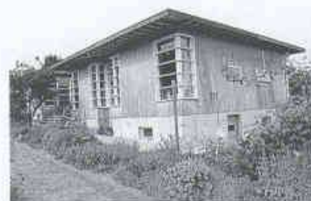
10 Einfamilienhaus in Hallau von Stefan Gerber. Die Fassade bleibt ungeschliffen und unbehandelt. Die natürliche Vergrauung des Holzes ist erwünscht