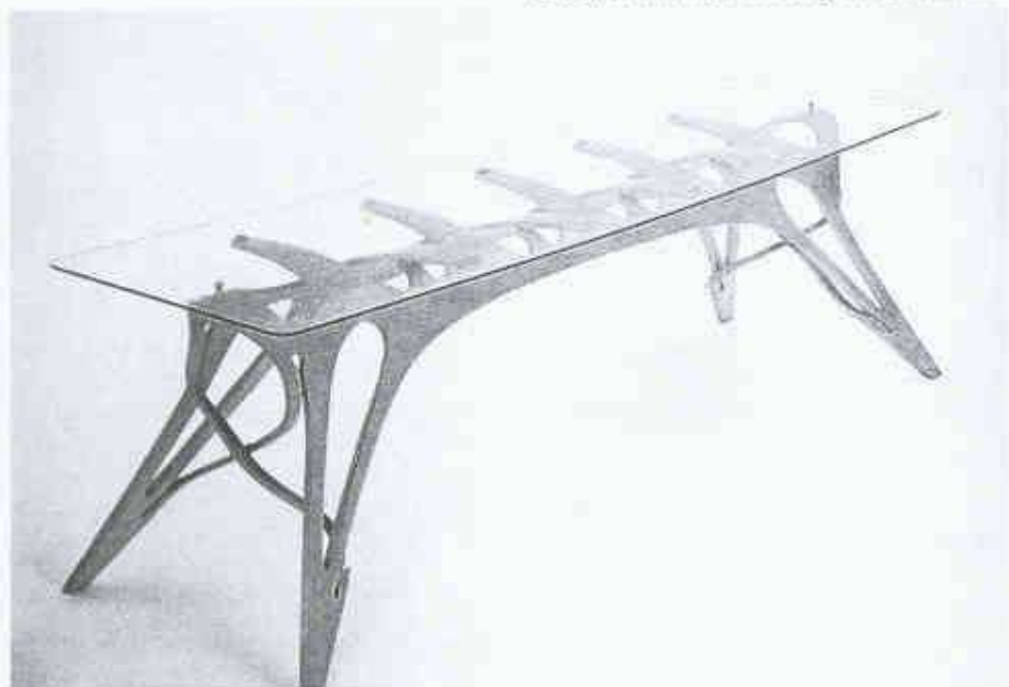
1 Tisch aus formgepresstem Sperrholz des italienischen Architekten und Designers Carlo Molino

Ein weiterer Grund für den wachsenden Sperrholzverbrauch liegt sicher darin, dass vermehrt illustre Vertreter der aktuellen Architekturszene den Werkstoff für ihre Bauten verwenden. Dies hat Sperrholz zu einiger Beachtung verholfen und zu einem Diskussionsthema in der Öffentlichkeit gemacht. Seine wachsende Sympathie bei Architekten und Bauherren gründet unter anderem auf der Wieder-