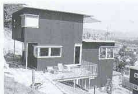
2 Blaue Hanghäuser in Brugg von Dietiker, Keller, Klaus. Die Maserung des Sperrholzes verändert das Gesicht der Bauten je nach Sonnenstand und Lichteinfall

Sperrholz profitiert zudem vom allgemein gestiegenen ökologischen Bewusstsein und der Sympathie, die Holz und den daraus hergestellten Holzwerkstoffen entgegengebracht wird. Sein schlichtes, holzmässiges Aussehen, seine Kompatibilität zu modernen Konstruktionskonzepten wie dem Holztafelbau und seine insgesamt positiv zu bewertende Ökobilanz kommen ihm ebenfalls zugute.