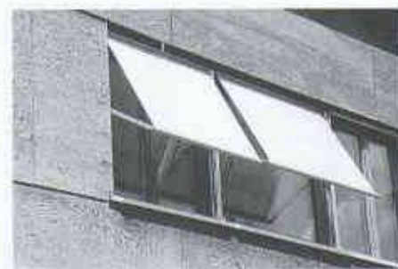
3 Haus Müller in Binningen von Hans-Peter Müller. Die intensive Maserung der unbehandelten Douglas-Fir-Sperrholzplatten wirkt als Ornament

Bereits die alten Ägypter kannten die eigentliche Grundlage der Sperrholzherstellung: das Sägen und Verarbeiten von Furnieren. Das älteste bekannte «Sperrholz» stammt aus der Zeit der Pharaonen