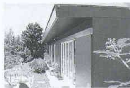
12 Anbau an ein Einfamilienhaus in Unterengstringen von Rudolf Moser. Das Haus ist in kräftigem Rot gestrichen