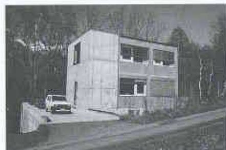
9 Einfamilienhäuser in Brig von Stefan Bellwalder. Die Häuser wurden grau gestrichen, um den natürlichen Vergrauungsprozess vorwegzunehmen