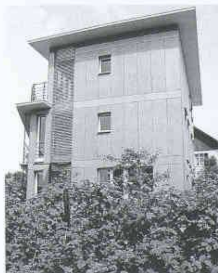
11 Bürohaus Markwalder in Brüttsellen. Die Sperrholzplatten wurden zu kleinen Formaten zugesägt. Sie dienen als Fassadenschmuck, die eigentliche Schutzfunktion übernimmt die darunterliegende Wetterhaut.