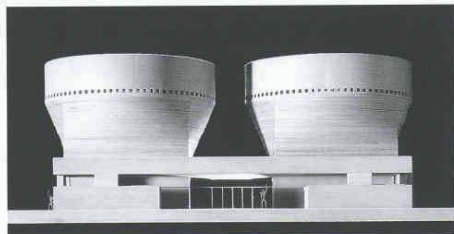
Modell mit der Eingangspartie