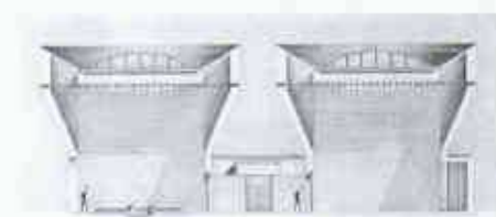
Schnitt durch Synagoge und Auditorium