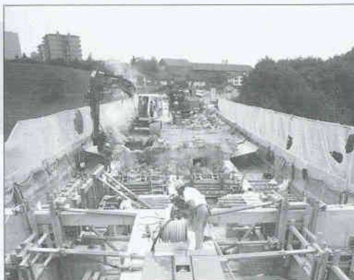
Sanierung und Verbreiterung der Pérolles-Brücke, Freiburg