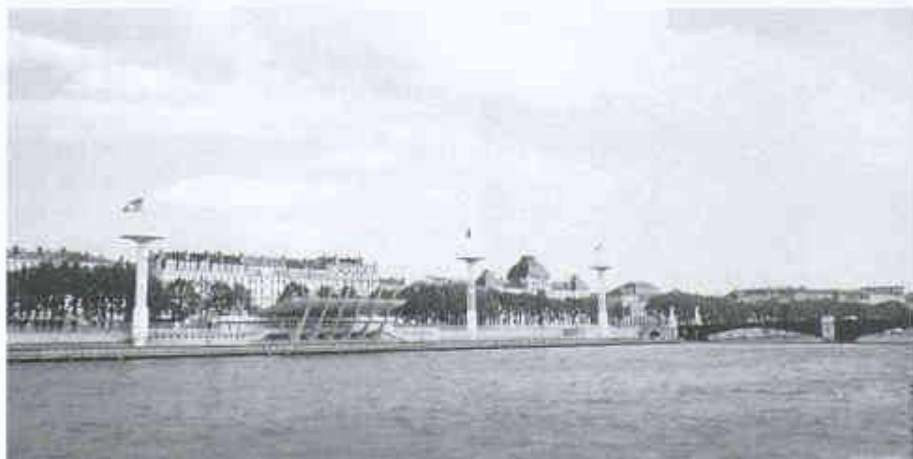
Die Rhone mit der Piscine du Rhône 2

Neben den gepressten, gekrümmten, pittoresken Strassenzügen am Fusse des Hügels erstreckt sich ein offenerer Teil, das eigentliche Zentrum der Stadt, auf der Halbinsel zwischen den beiden Flüssen,