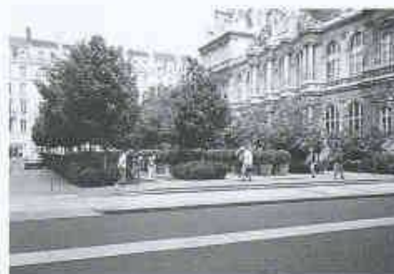
Place de la Bourse

als repräsentatives Vorfeld der Börse gedacht, ist dafür aber etwas schmal. Unmittelbar vor der monumentalen Freitreppe, etwas versetzt, liegt der Treppenaufgang aus der neuen Tiefgarage. Die relative Enge des Platzes ist nun überspielt nicht mit irgendwelchen raumweitzenden Massnahmen, sondern im Gegenteil mit einer äusserst dichten, gereihten halbhoher Bepflanzung, die zum Teil in Rabatten, zum Teil in Kübeln steht. In diese bewegte, künstlich-natürliche Topographie sind sparsam Bänke eingelassen, die eine Art offene Intimität ermöglichen und einen Ort schaffen, wie ihn Städte oft, Plätze aber nur selten kennen.