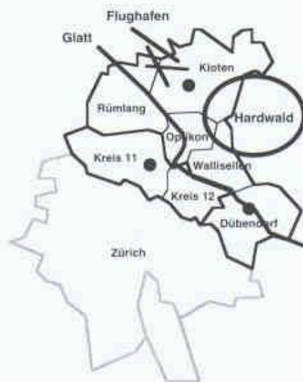
1 In der «Glattal-Stadt» wohnen 145 000 Einwohner und arbeiten 90 000 Beschäftigte

Zudem müssen sich langfristige Planungs visionen vorerst als «Bruchstück-Kunst» bewähren. Damit erhöht sich die Bedeutung guter Adressen bzw. lebenswerter Quartiere. Es ist auch kein Zufall, dass sich beim Computerspiel «Sim City» öffentliche Einrichtungen wie zum Beispiel Parkanlagen auszahlen.